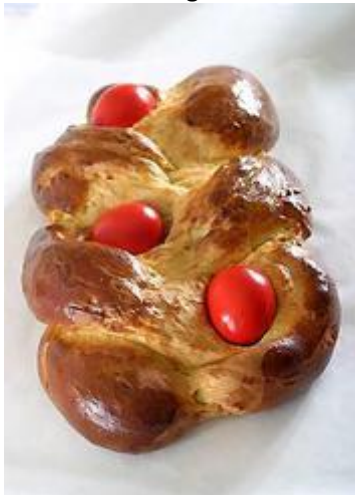
Paasbrood (Griekse traditie)

De Paashaas! De lente is de tijd dat de aarde weer vruchtbaar wordt, althans hier in het westen, dat er nieuw leven komt. Dit zien we terug komen in de haas, die staat voor vruchtbaarheid. Er zijn pogingen geweest om deze haas te kerstenen: men zag hier dan een beeld van de opgestane Heer in, die immers net als een haas, zomaar verscheen...en ook weer verdween. Die notie van vruchtbaarheid zien we ook terug bij de eieren die symbool zijn van het nieuwe leven: het ei zou de graftombe waaruit Jezus is opgestaan, symboliseren. Christenen in het nabije oosten schijnen op witte donderdag de eieren rood te schilderen als symbool van Christus bloed.